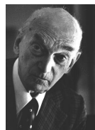
Frederic Mompou (1893 – 1987) - Chanson de berseau (4'15")