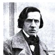
Frédéric Chopin (1810 - 1849) - Nocturne c sharp minor op. posth. ( 4 ' 50" )