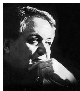
Manos Hadjidakis (1925 – 1994) For a little white seashell(25' 00'') -March -Conversations with S Prokofiev -Madinada -Nocturne -Pastorale

-Syrtos -Tsamikos -Ballos -kalamatianos -Grand sousta