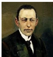
Sergei Rachmaninov (1873 - 1943) - Prelude op.32 no 5 (3' 50") -Prelude op.32 no 12 (2' 45")