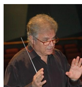
Theodore Antoniou (*1935) -4 little canons (6' 00")

-Syrtos -Tsamikos -Ballos -kalamatianos -Grand sousta